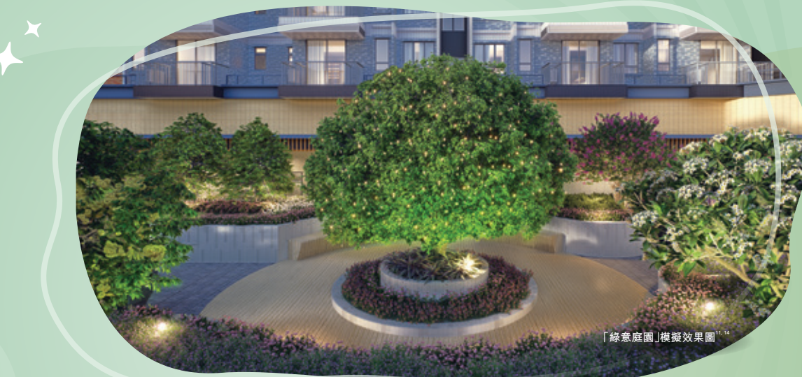
「綠意庭園」模擬效果圖 13