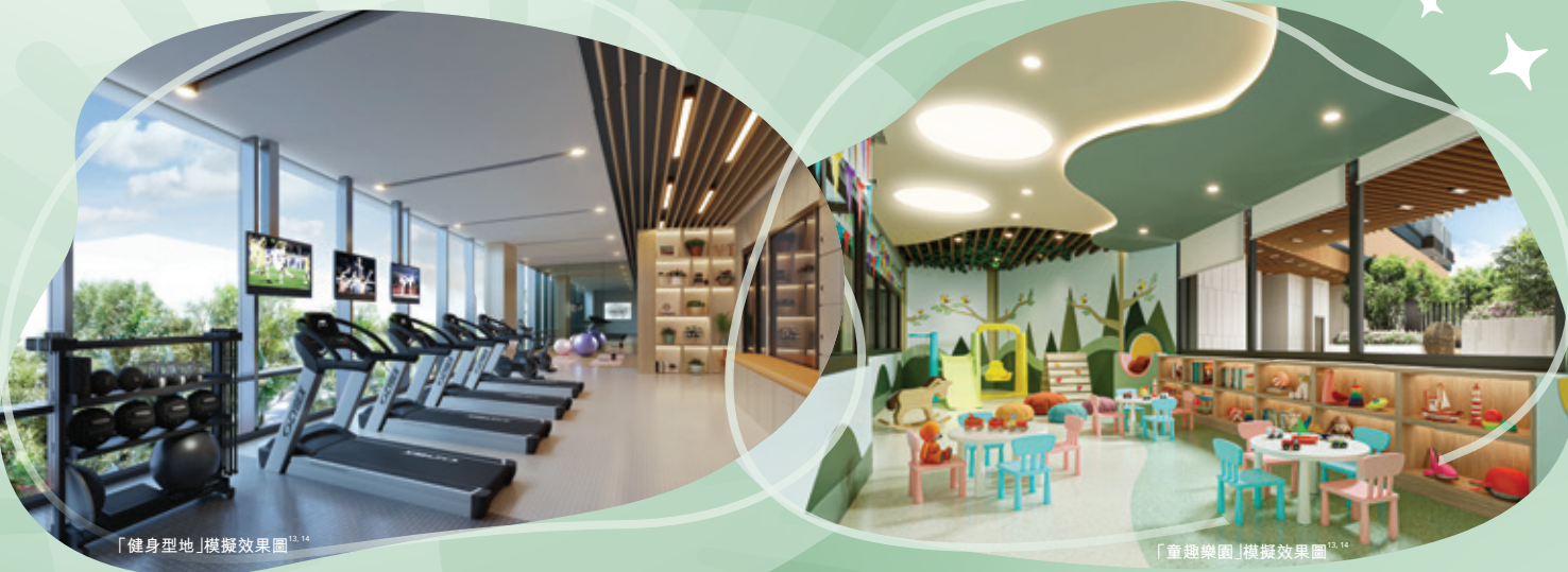
「健身型地」模擬效果圖 14