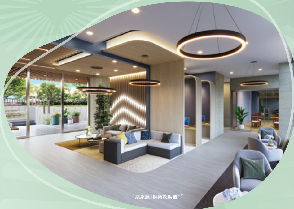
「樂聚廳」模擬效果圖 14

「聚然」特設住客專屬會所「聚賢 The Fab」 14 ，設施包括樂聚廳、童趣樂園、健身型地及牌藝室等 15 ，讓住戶於閒暇時盡情放鬆。項目規劃集綠化和休憩空間於一身；二樓平台種植了各式各樣的植物，帶來舒適清新的感覺；平台設有親子農園，住戶可與孩子一起種植，觀賞花卉和蔬果，並將收成與他人分享。舉步之內即可擁抱綠意園林，享受寫意生活。