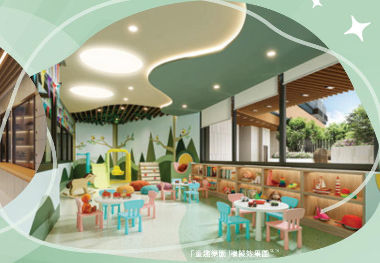
「童趣樂園」模擬效果圖 14