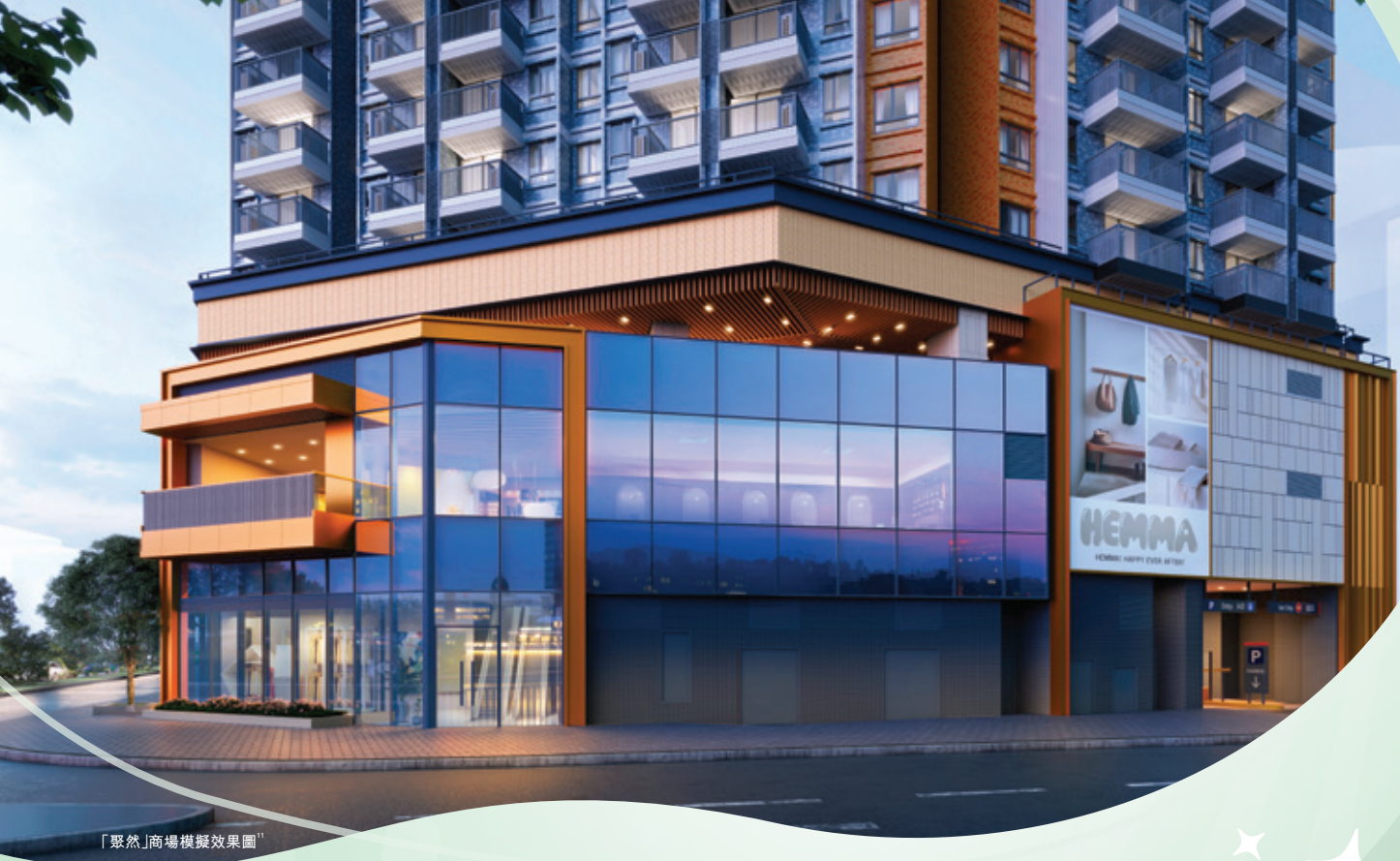
「聚然」商場模擬效果圖 16